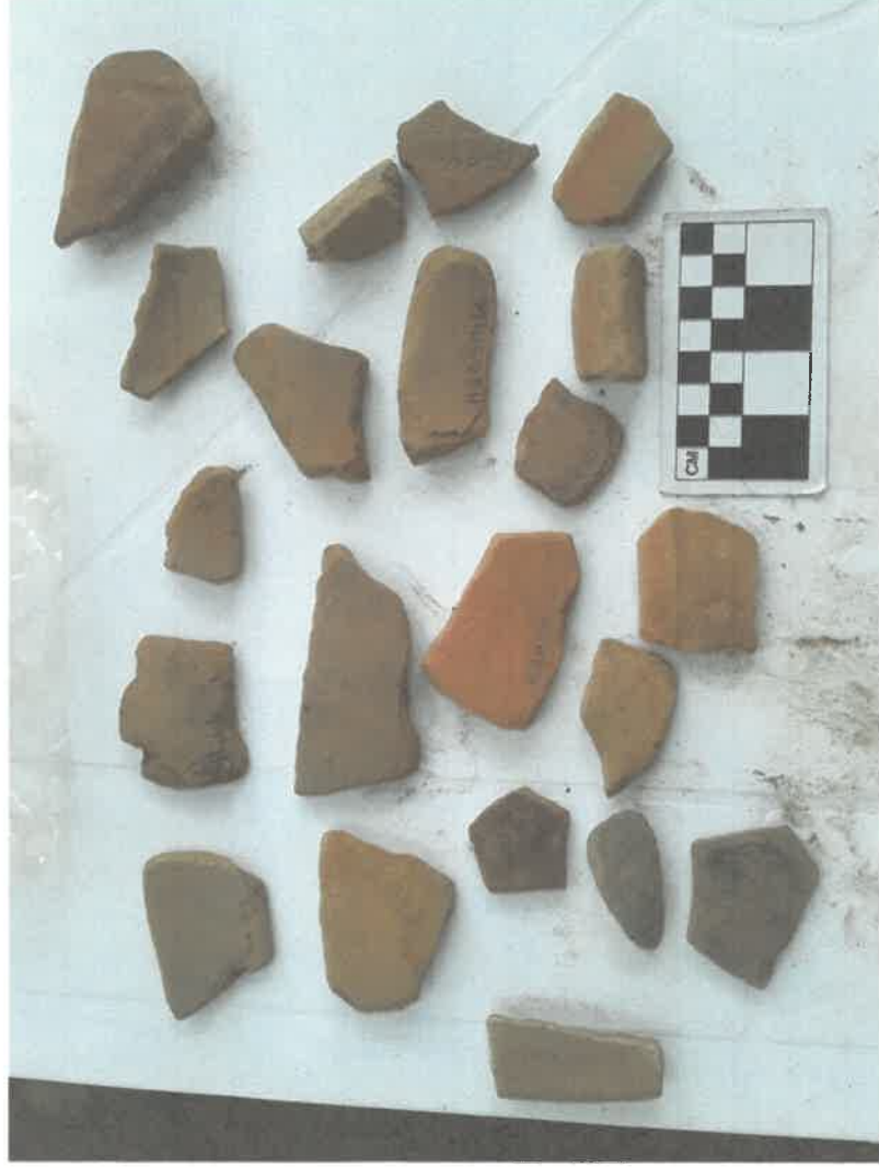
Figura 1. Cerámica de la operación H8asn/12, Preclásico Medio fase NII (500 – 100 a.C.).