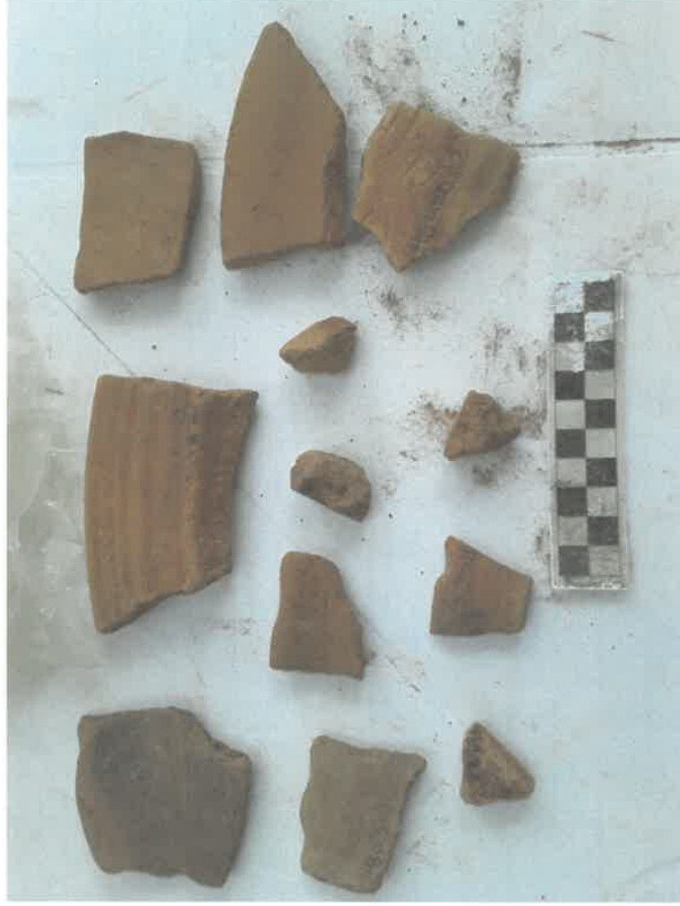
Figura 2. Cerámica de la operación H8asn/13, Preclásico Medio fase NII (500 – 100 a.C.).