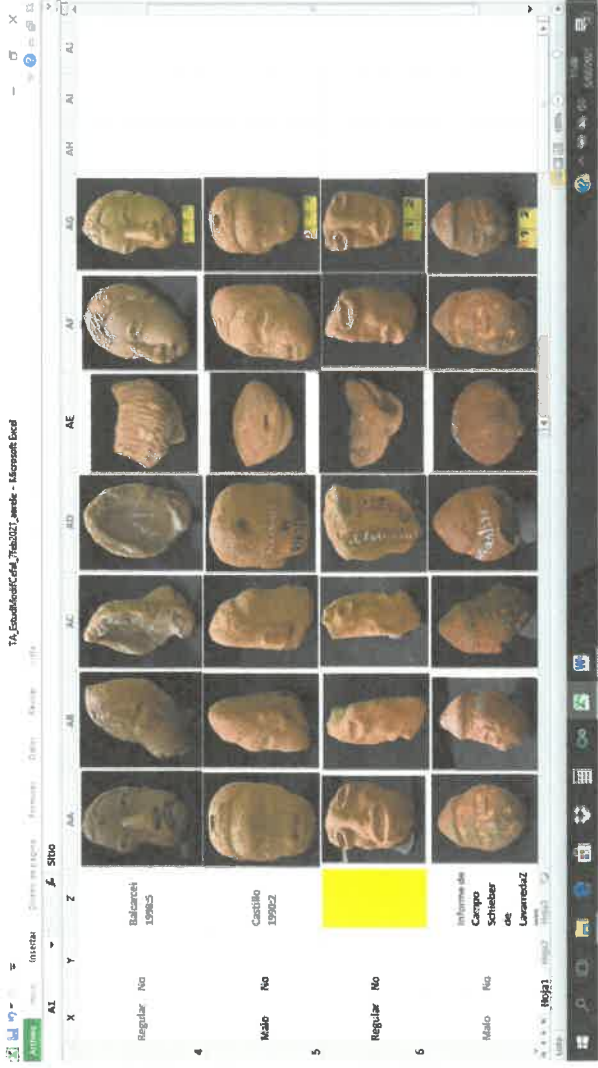
Figura 7. Los siete ángulos de las fotografías del estudio de "Modificación Cefálica de las Figurillas de Tak'alik Ab'aj".