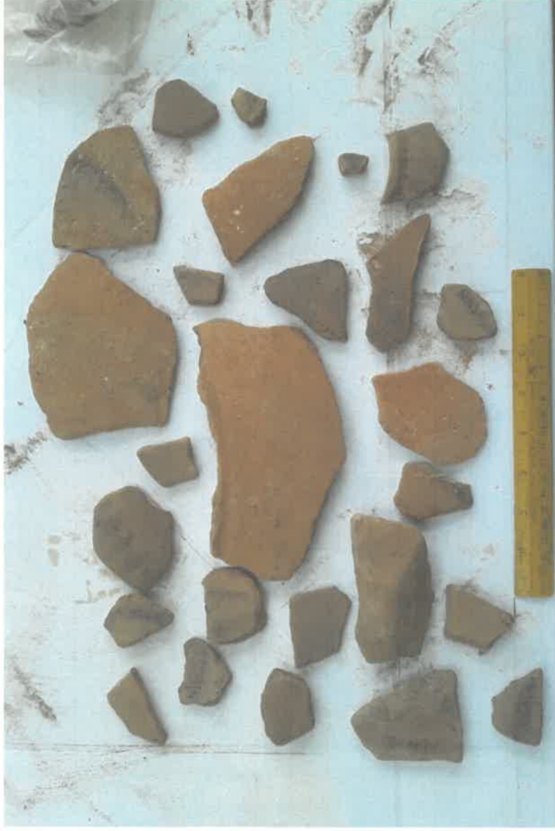
Figura 3. Cerámica de la operación H8asn/14, Preclásico Medio fase Nil (500 – 100 a.C.).